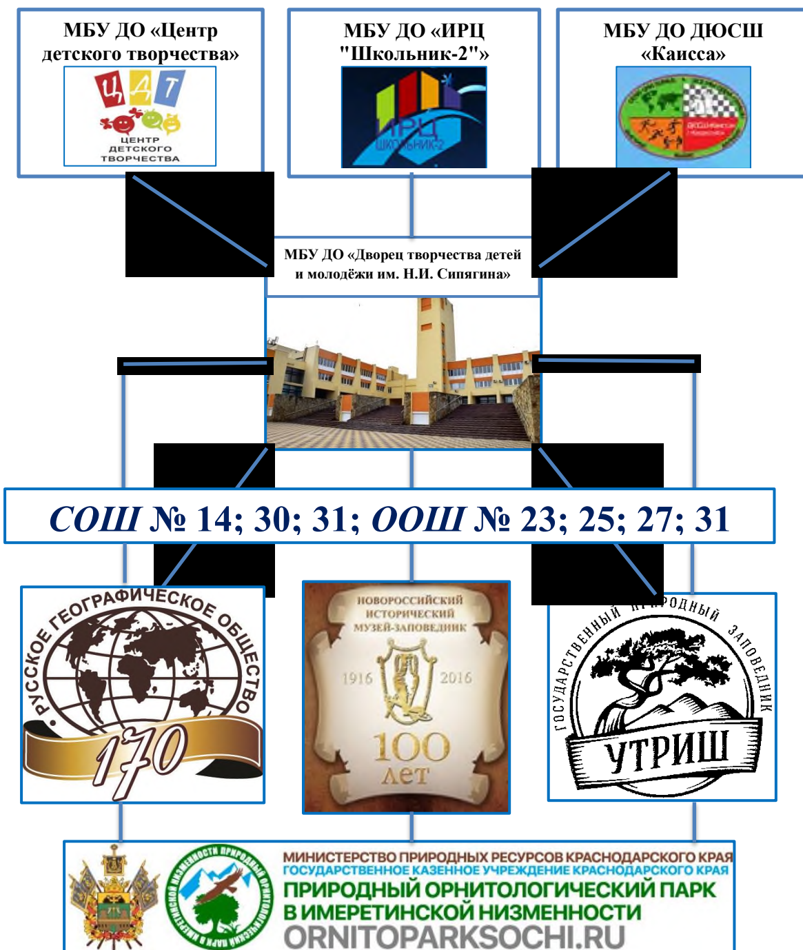
СХЕМА Интегративной модели